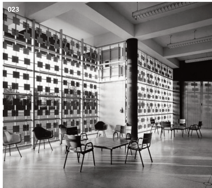
023 EDU R4-A Centro Universitario University Center Arquitecto Architect Henry Klumb Fechas Dates 1960-1965 Dirección Address Universidad de Puerto Rico, Recinto de Río Piedras, San Juan, Puerto Rico Ubicación Location 55° 54' 45" N 67° 34' 23" E Fotografía Photograph AACUPR Tipo Type Educación Education Transporte público Public transport Bus C1, D45, T7 Tren Urbano - Universidad

Calle Manuel Rivera Ferrer, San Juan, Puerto Rico Ubicación Location 18.404669, -66.0980833 Fotografía Photograph AACUPR Tipo Type Residencial Residential